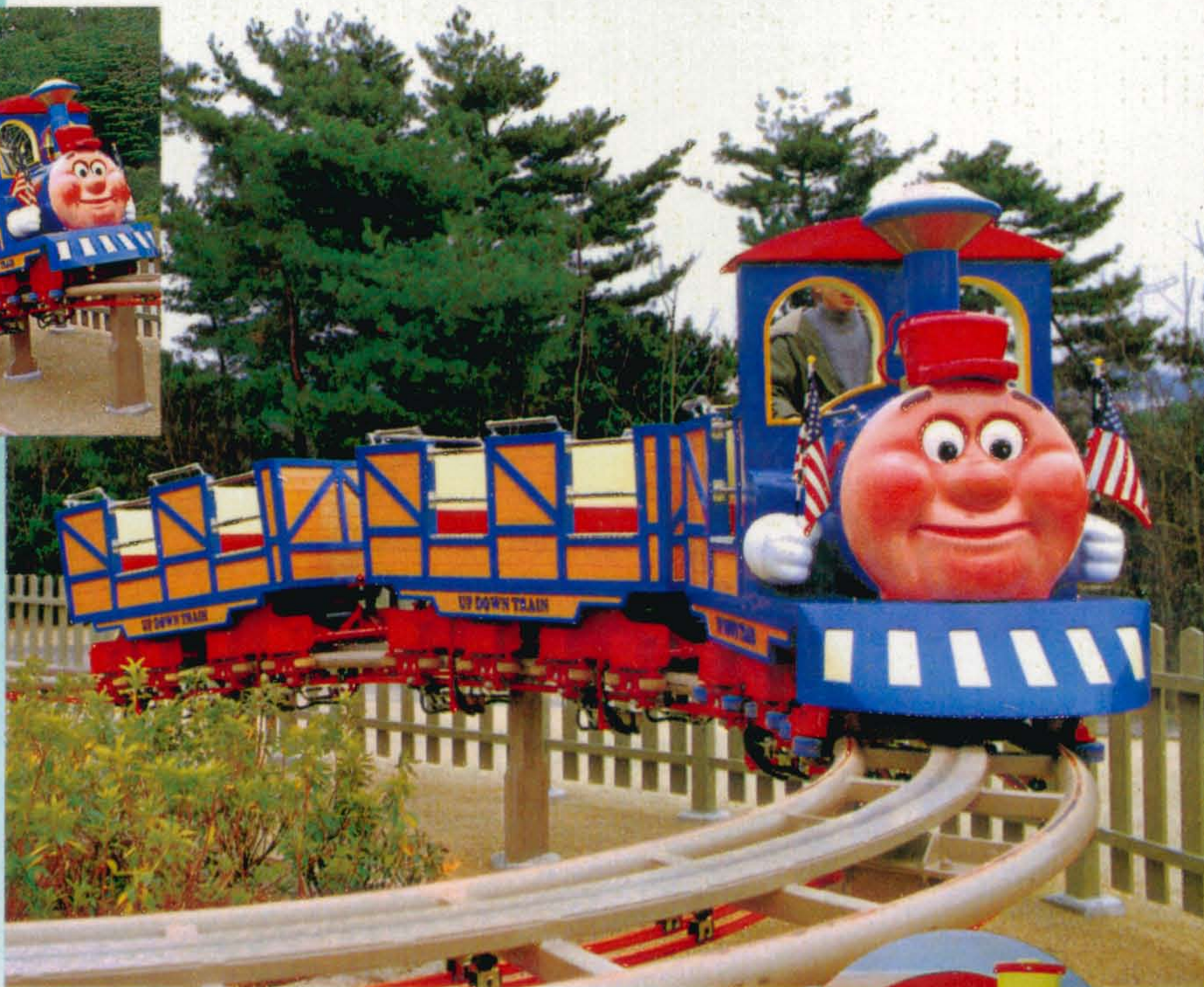
▲大阪府の「みさき公園」で好評稼働中。(レール長さ88m、パイフレール使用)

《アップダウントレイン》は、ミニコースタータイプの遊園列車です。通常の汽車にはないスピード感とアップダウン走行は、これまでになく新鮮。特に、ゆっくり登ってスピーディに下る、変化に豊かな走行はとてもスリリングで、ダイナミックな印象です。しかも子供でも乗れる安全設計。先頭の機関車は2人乗りで、客車は4人乗りを2輛まで連結できるため、休日などの繁忙日には抜群の稼働率を発揮します。また機関車はアニメティックなデザインと、飽きのこないノーマルタイプの2種類を用意。トラックタイプの「コンボイ」も発売する予定です。もちろんレールレイアウトはロケ地に合わせて設計可能で、確認申請などの手続きも朝日エンジニアリングが代行しますので安心です。