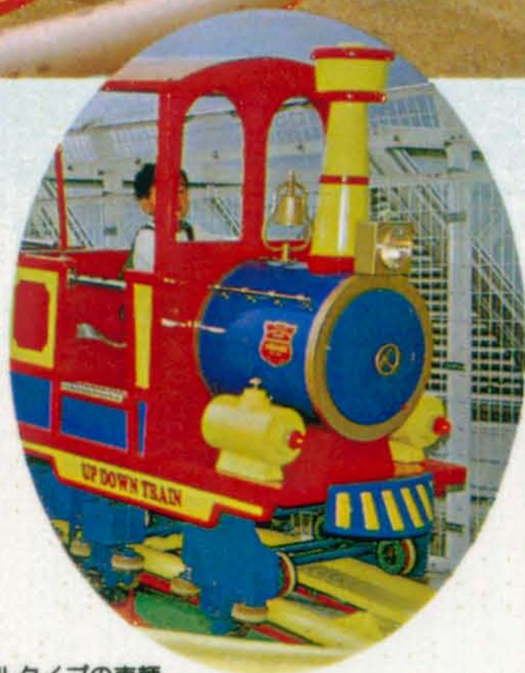
▶飽きのこないノーマルタイプの車輦